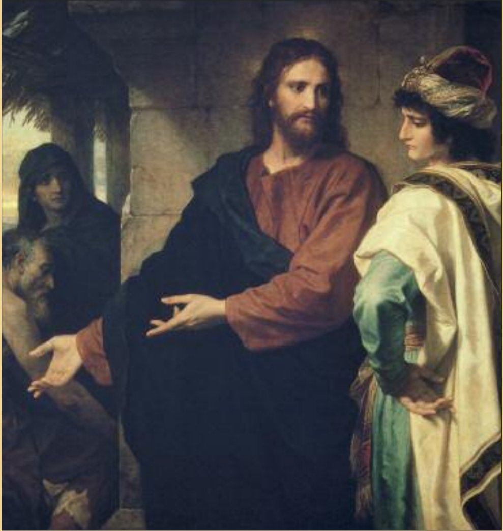
JOHANN MICHAEL FERDINAND HEINRICH HOFMANN (1824-1911) Cristo e il giovane ricco , 1889 (New York, Riverside Church)