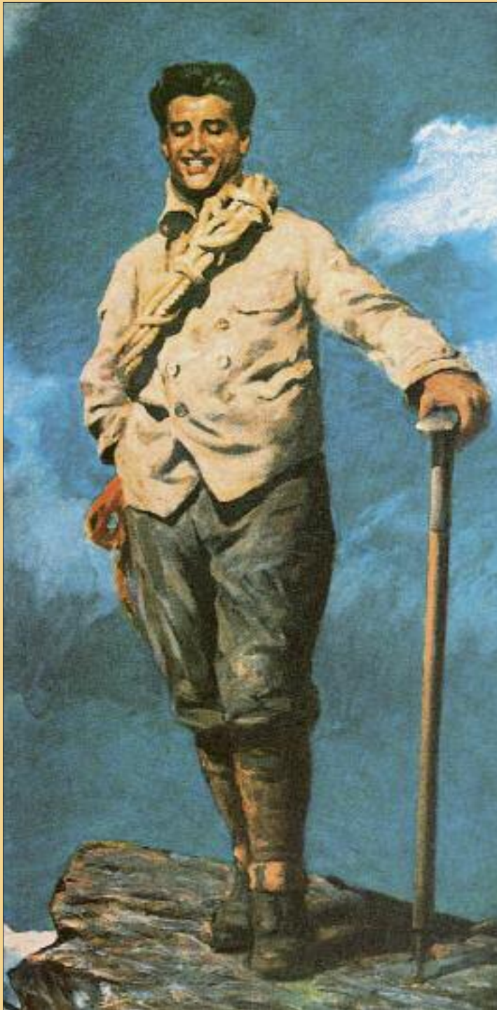
Pier Giorgio Frassati