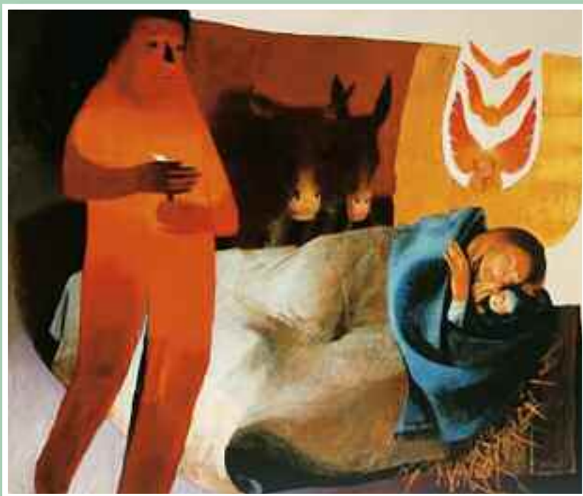
ARCABAS (JEAN-MARIE PIROT), Natività